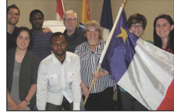
La section Samuel de Champlain affiche sa fierté acadienne.