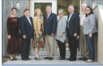
Rencontre avec le gouvernement provincial